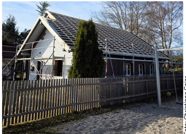
Aktueller Stand beim „Holzhäusel“

Jetzt schon vormerken – weitere Informationen folgen.