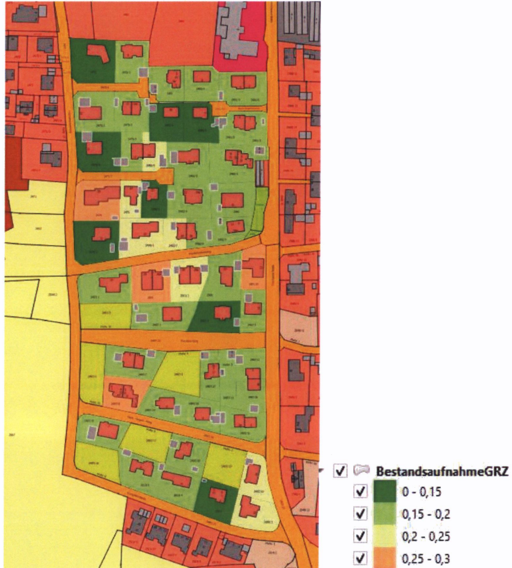
Abb. 2 Plangebiet, ohne Maßstab, Stand 16.10.2021

Das Plangebiet ist in offener Bauweise mit Einzel- und Doppelhäusern bebaut. Neben Einfamilien- gibt es auch Mehrfamilienhäuser. Die festgesetzte GRZ von 0,2 wird weit überwiegend eingehalten. Auf 11 Grundstücken wird sie überschritten, 4 Flächen davon liegen > 0,25, maximal werden 0,29 erreicht. Im südlichen Teil des Plangebietes sind 6 Grundstücke noch unbebaut.