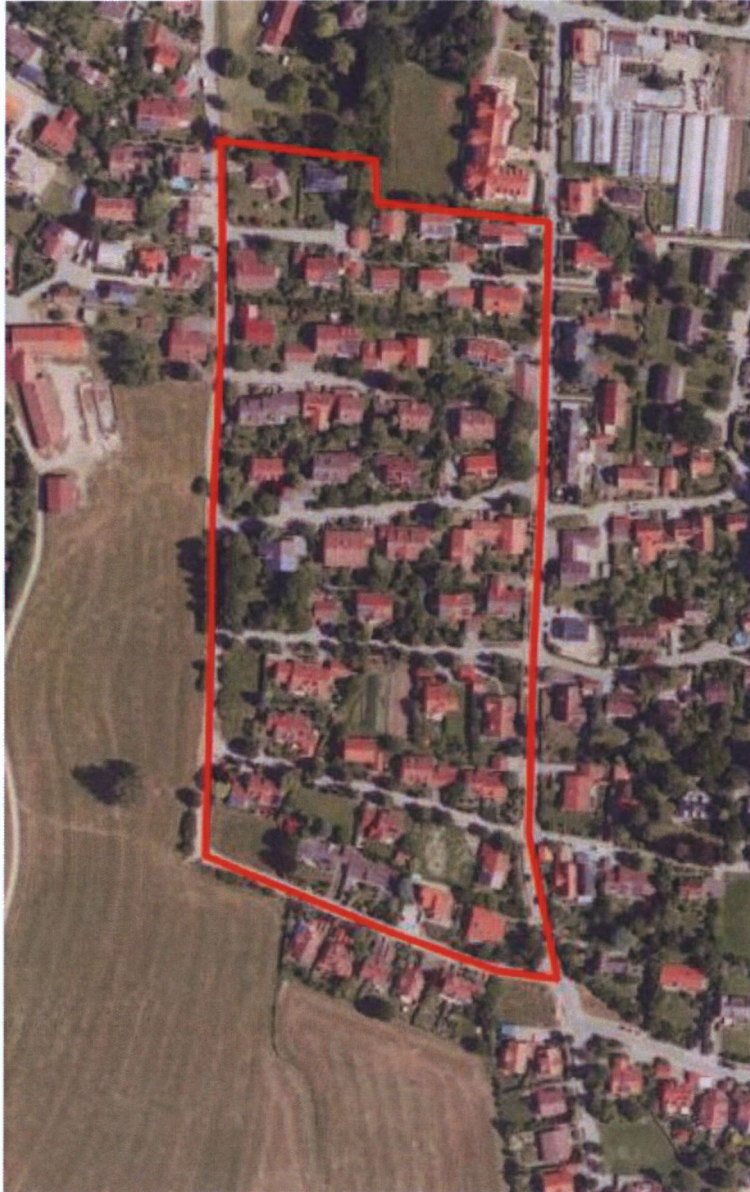
Abb. 1 Plangebiet, ohne Maßstab, Stand 22.03.2023