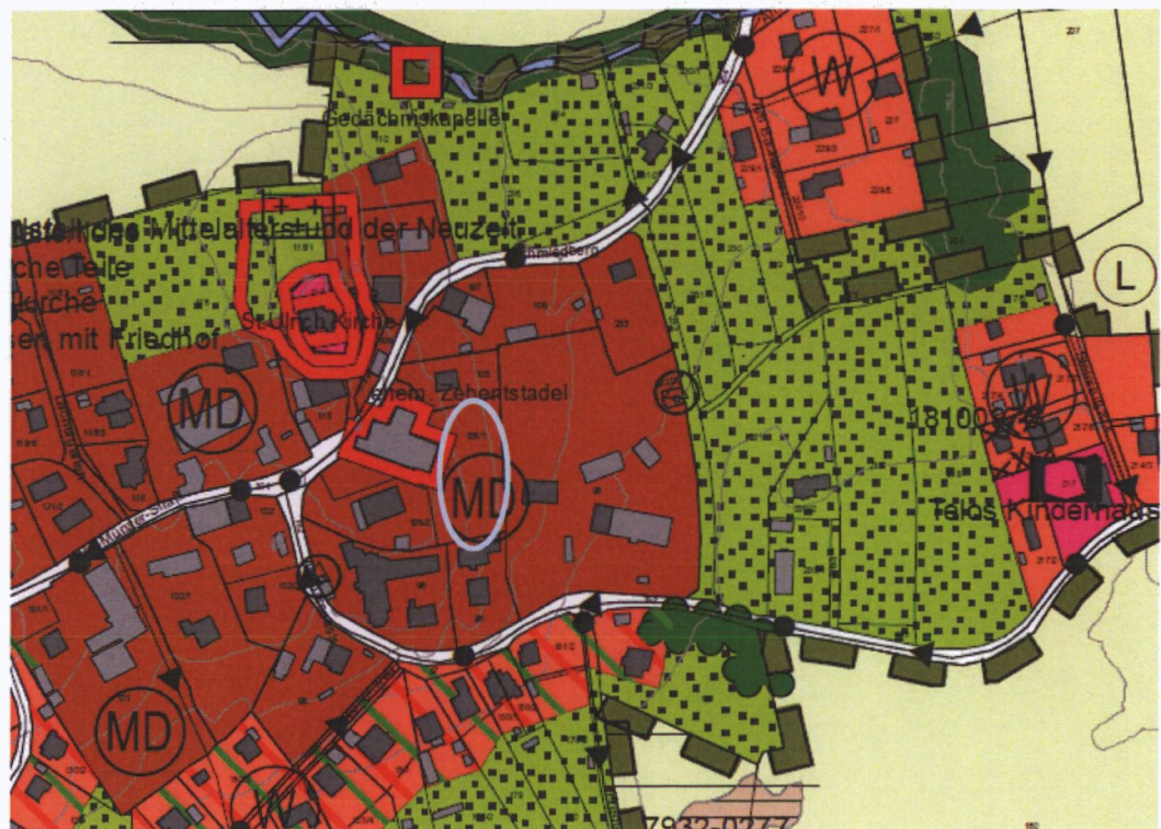
Abb. 1 Ausschnitt aus dem wirksamen FNP, ohne Maßstab

Der Flächennutzungsplan ist seit 17.11.2013 rechtswirksam und stellt das Plangebiet bereits als Dorfgebietsfläche dar.