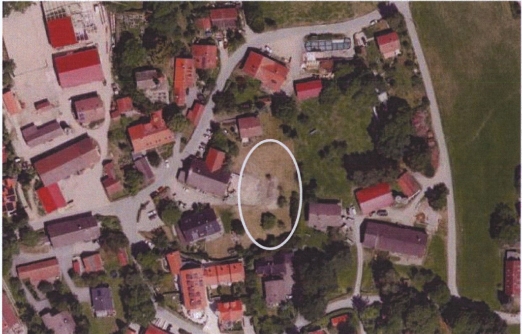
Abb. 2 Plangebiet, ohne Maßstab, Quelle: BayernAtlas, © Bayerische Vermessungsverwaltung, Stand 10.2023

Das Plangebiet befindet sich unweit des Zentrums von Holzhausen östlich der Straße ‚Schmiedberg‘. Es umfasst die östlichen Bereiche der Grundstücke mit der Fl.-Nr. 105/1, 105/3 und 105/4. Die Grundstücke fallen vom Schmiedberg in östlicher Richtung ab.