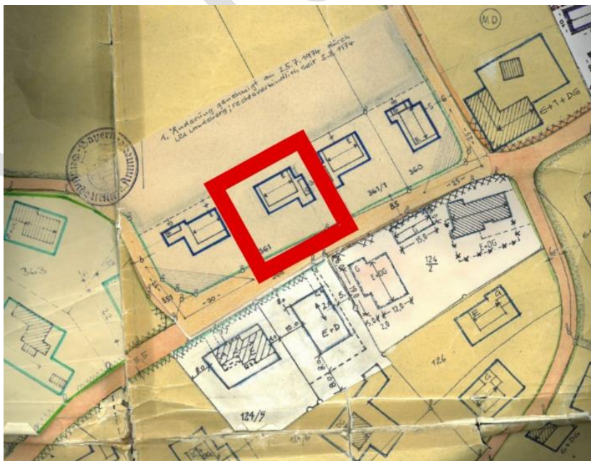
Abb. 2 1. Änderung des Bebauungsplanes Holzhausen-West genehmigt am 25.07.1974 und der Geltungsbereich der 16. Änderung, ohne Maßstab

Bereits ca. fünf Jahre nach dem ursprünglichen Bebauungsplan „Holzhausen-West“ wurde dessen erste Änderung beschlossen (Fassung vom 25.07.1974). In dieser 1. Änderung wird insbesondere die Teilung eines Grundstücks vorgeschlagen, was zugleich den Geltungsbereich der aktuell vorliegenden 16. Änderung erkennen lässt.