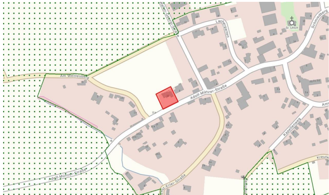
Abb. 3 LSG und Biotope, ohne Maßstab, Quelle: Bayerische Vermessungsverwaltung, Stand 05.09.24