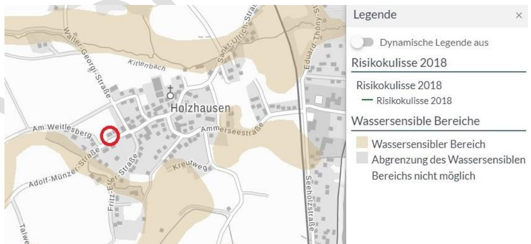
Abb. 3 Wassersensibler Bereich, ohne Maßstab, Quelle: UmweltAtlas, Stand 2018

Das Plangebiet liegt außerhalb des wassersensiblen Bereichs, sodass keine erhebliche Beeinträchtigung zu erwarten ist.