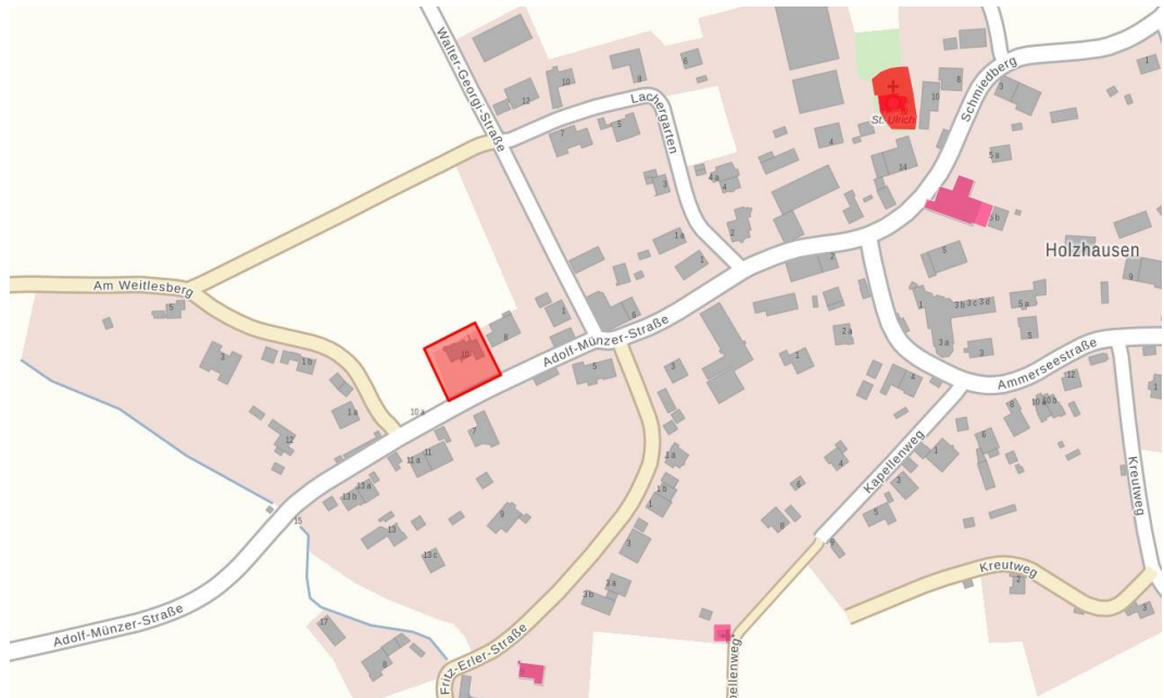
Abb. 4 Bau- und Bodendenkmäler, ohne Maßstab, Quelle: Bayerische Vermessungsverwaltung, Bayerischer Denkmal-Atlas, Stand 05.09.24

Archäologische Fundstellen werden im Geltungsbereich und im näheren Umfeld nicht vermutet. (Auf die ungeachtet dessen nach Art. 8 DSchG bestehende Meldepflicht an das Landesamt für Denkmalpflege oder die Untere Denkmalschutzbehörde beim Landratsamt bei evt. zu Tage tretenden Bodenfunden wird unter Nr. 8 im Teil B der Satzung hingewiesen.)