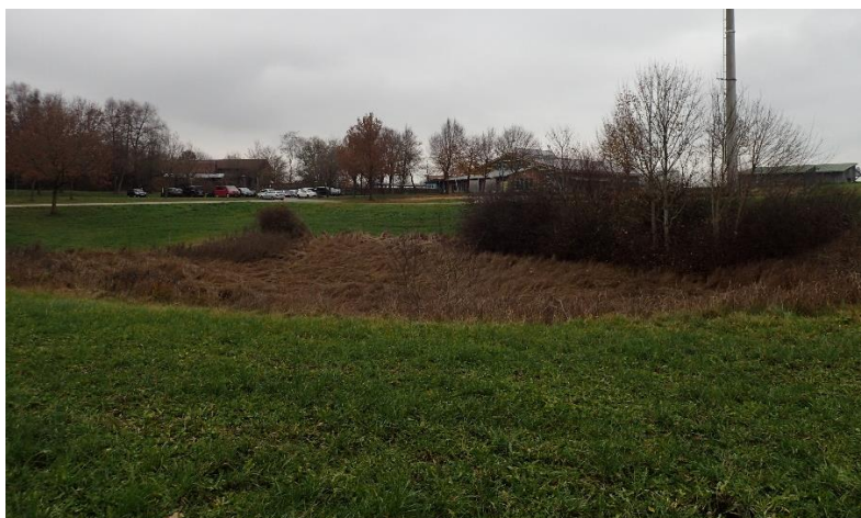
Abbildung 1: Intensivgrünland um die Sukzessionsfläche.

Die Sukzessionsfläche wird wiederum von intensivem Grünland umgeben, das keine wertgebenden Strukturen für die Fauna aufweist (siehe Abbildung 1).