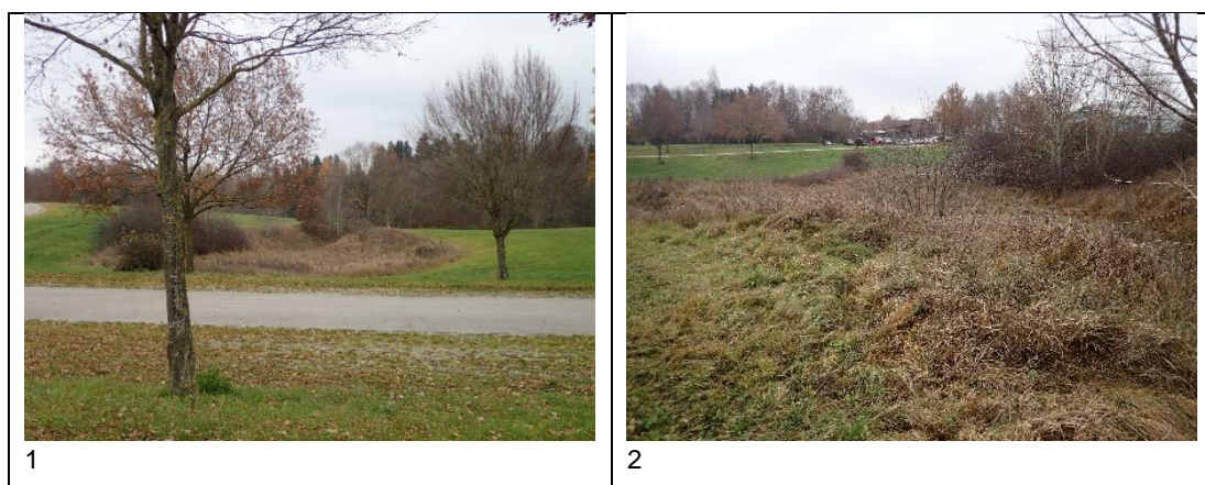
Tabelle 1: 1: Blick nach S auf das Plangebiet; 2: Nahbereich auf die Mulde mit geschlossener Pflanzendecke; 3: Randvegetation um die Mulde; 4: dichte, dornentragende Heckenrose; 5: zusammenhängendes Gebüsch im O; 6: umgestürzter Hochsitz im SO; 7: Gehölzkomplex mit Laubbäumen im S; 8: Blick nach SO zum LSG und Biotop.