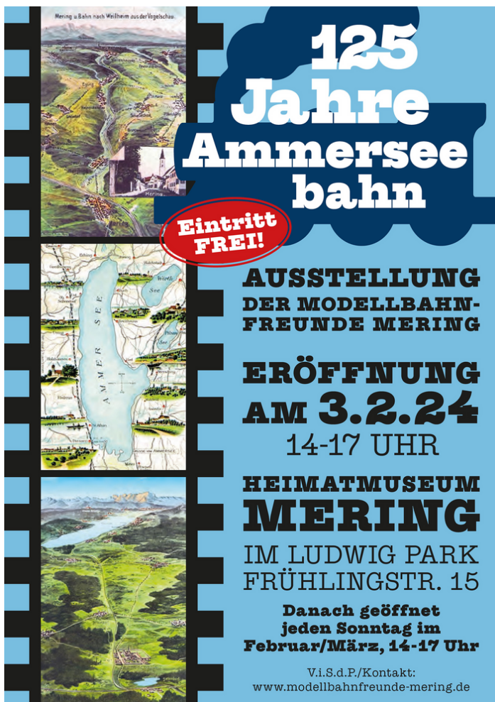
Abb.: Modellbahnfreunde Mering