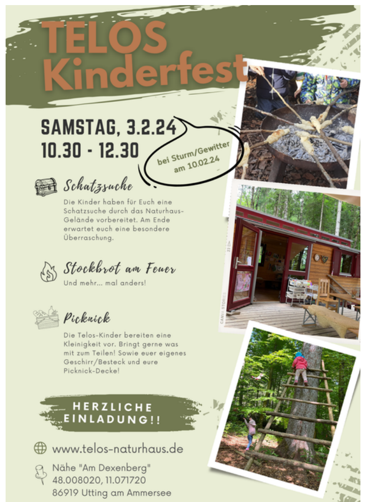
Abb.: Telos Naturhaus