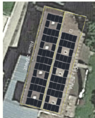
Abb.: LENA Solar GmbH