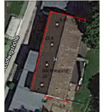
Haus für Kinder