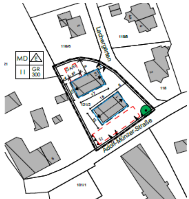
Abb.: PMG Architekten

Das Grundstück mit der Flurnummer 121/2 gehört zum Bereich des gültigen Bebauungsplans Holzhausen West. Der Plan wurde zuletzt am 29.07.2004 geändert. Jetzt soll es eine weitere Änderung geben, die die Nutzung des Grundstücks betrifft. Es geht dabei um die Erlaubnis, das Gebiet auch für Wohnzwecke zu nutzen, die Neugestaltung von Garagen und Parkplätzen sowie die Erlaubnis, andere Dachfarben zu verwenden. Die Änderung des Bebauungsplans wird im sogenannten beschleunigten Verfahren nach § 13 a des Baugesetzbuchs (BauGB) durchgeführt. Dabei wird auf einen separaten Umweltbericht verzichtet, um den Prozess zu vereinfachen (gemäß § 13 Abs. 3 BauGB). Der Gemeinderat beschloss die 15. Änderung des Bebauungsplans "Holzhausen-West" für das Grundstück 121/2 und stimmte dem vorgelegten Entwurf für die Änderung zu.