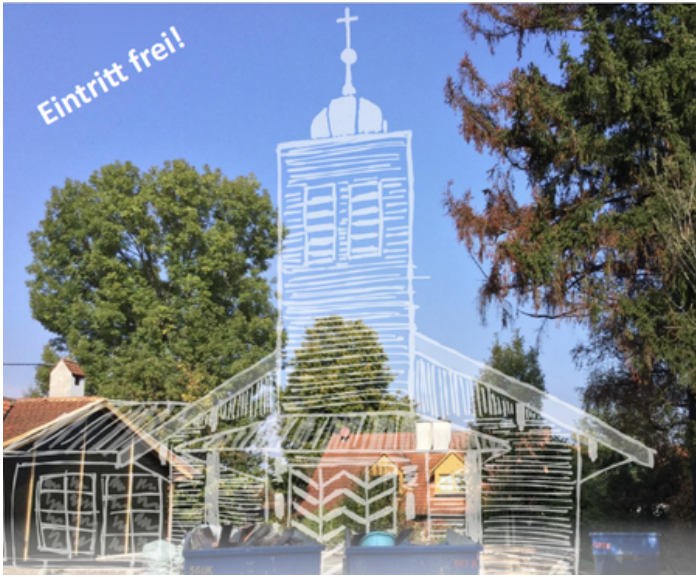
Abb. und Text: Evang.-Luth. Kirche Ammersee West

Die beiden Gospelchöre „Sing & Joy“ aus Utting und „Gospel Groove“ aus Kaufering geben am Samstag, 3. Februar 2024 um 19.30 Uhr gemeinsam ein großes Konzert in der Autobahnkirche „Maria am Wege“ in Windach. Der Eintritt ist frei, es werden Spenden für die neue evangelische Christuskirche in Utting gesammelt. In der Konzertpause bei Saft & Sekt können Gäste sehen, wozu ihre Spenden verwendet werden: Im angrenzenden Pfarrsaal zeigt eine Präsentation Erinnerungen an die abgebrannte alte Christuskirche sowie den Planungsfortschritt des neuen Zuhauses der evangelischen Gemeinde Ammersee-West. Mehr Informationen erhalten Sie auf der Homepage der evangelischen Gemeinde Ammersee West oder dem Evang.-Luth. Pfarramt Dießen-Utting.