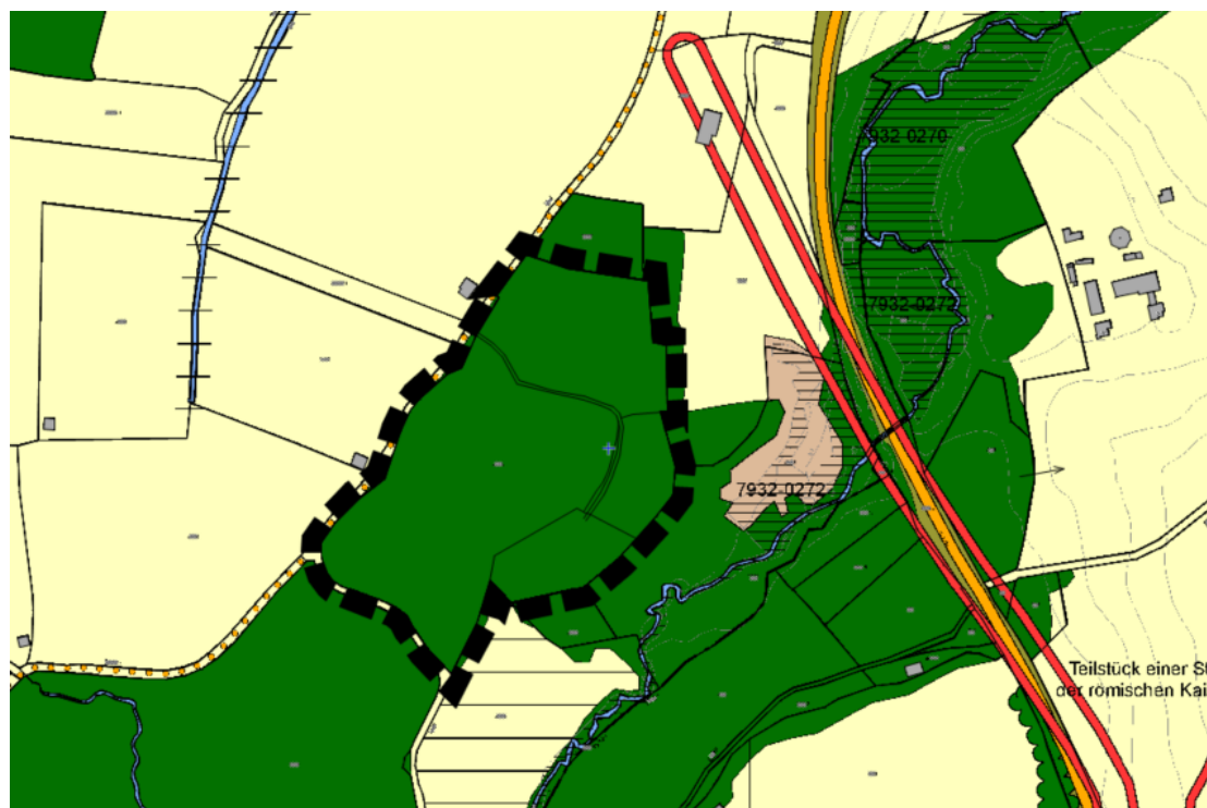
Abb. 1 Ausschnitt aus dem wirksamen FNP mit Lage der 2. Änderung, ohne Maßstab