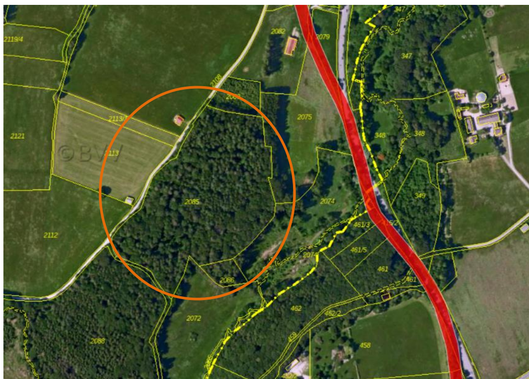
Abb. 3 Plangebiet (orange) mit Bodendenkmal (rot) , ohne Maßstab, Quelle: BayernAtlas, © Bayerische Vermessungsverwaltung

Östlich des Plangebiets liegt das Bodendenkmal D-1-7932-0104, Straße der römischen Kaiserzeit (Teilstück der Trasse Augsburg-Brenner).