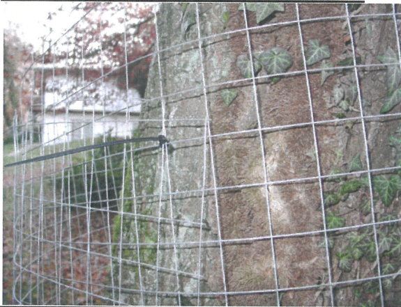
Abb.5: Zusammenmontieren der Enden