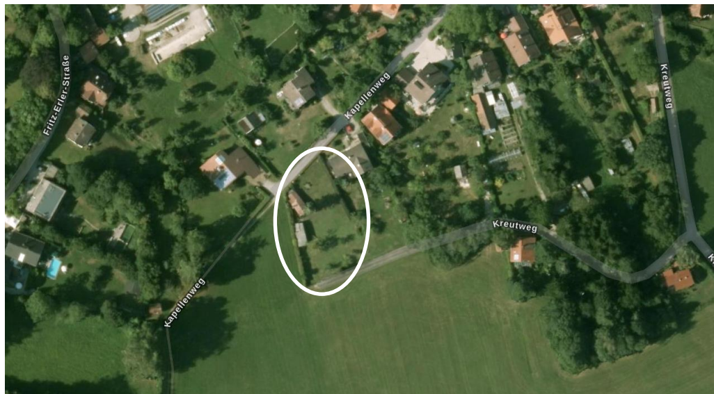
Abb. 2 Plangebiet, ohne Maßstab, Stand 09.04.2020

Das Plangebiet befindet sich am südlichen Ortsrand von Holzhausen zwischen Kapellenweg und Kreutweg. Es umfasst ausschließlich und vollumfänglich das Grundstück mit der Fl.-Nr. 152/3. Das Grundstück fällt vom Kapellenweg in südliche Richtung ab.